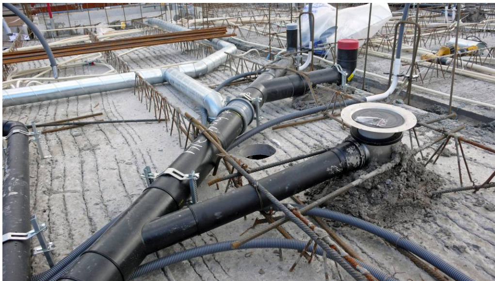
Figur 1. Bild som visar en arbetsplats där flera olika kategorier av yrkesarbetare samsas på samma arbetsyta

Det är också önskvärt att dokumentera arbetsinstruktioner för de till byggnadsarbeten angränsande arbetena dvs arbeten som utförs samordnat med dem (installations- och sido-/underentreprenader). Det är angeläget att vid arbetsberedningar kunna studera hur dessa samtidigt pågående arbeten utförs och påverkar de egna arbetena – särskilt de moment som av erfarenhet är orsak till problem för bägge parter. Kan byggnadsarbetarna ta del av hur installationsarbeten utförs genom Ai kan bland annat strukturplaner upprättas som möjliggör att arbetena utförs i rätt/rationell ordning och på rätt sätt.