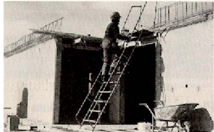
Trappan är 2,7 m hög och 0,6 m bred