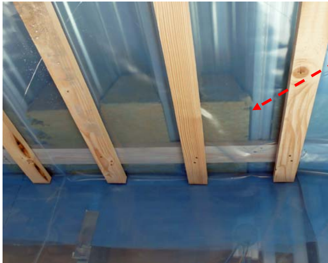
Eldragning i tak.

Notera att ångspärren är monterad under plåtarna. Så många genomgångar av kanaler, rör och eldragningar i plåtarna medförde att det ej gick att få ångspärren tät på ovansidan.